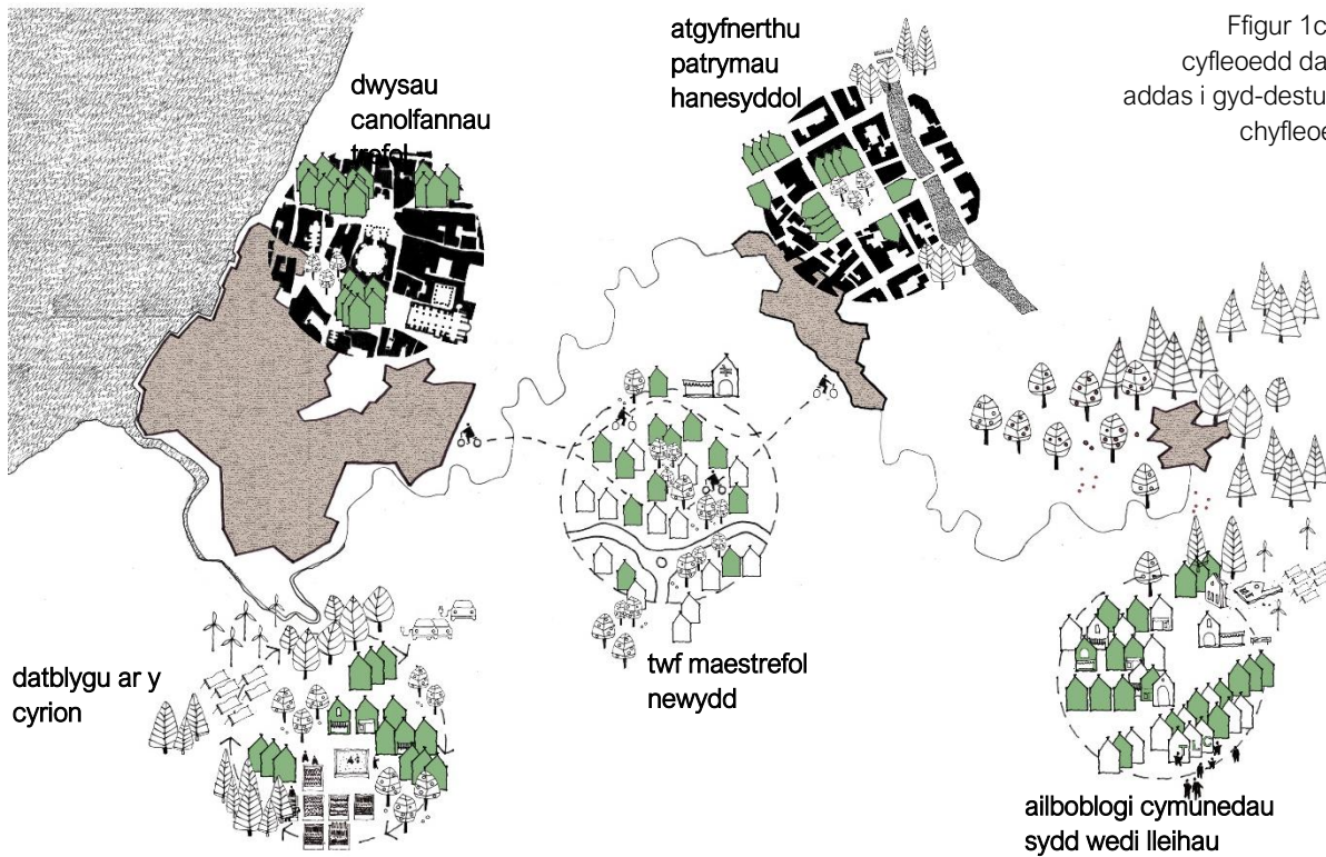
Ffigur 1c a Thabl 1: cyfleoedd datblygu sy'n addas i gyd-destun, heriau a chyfleoedd Cymru