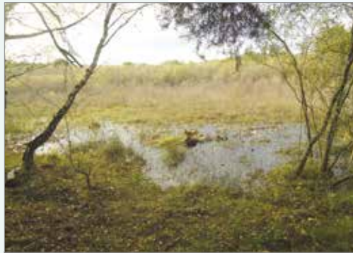
Cors agored yng Ngwarchodfa Natur Aberithon. Open bog at Aberithon Nature Reserve.

Reserve near Newbridge-on-Wye (SO016553) was recorded by Professor Brook as one of several sites in the UK for a newly described desmid Cylindrocystis cushlekae but, in September 1992, a sample from a Sphagnum pool on the site produced a desmid which proved to be of a species new to science, Spirotaenia cambrica !