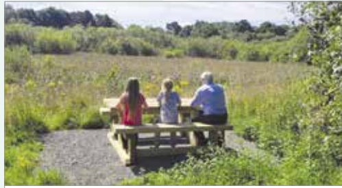
Corslwyn yng Ngwarchodfa Natur Aberithon Reedbed at Aberithon Nature Reserve.