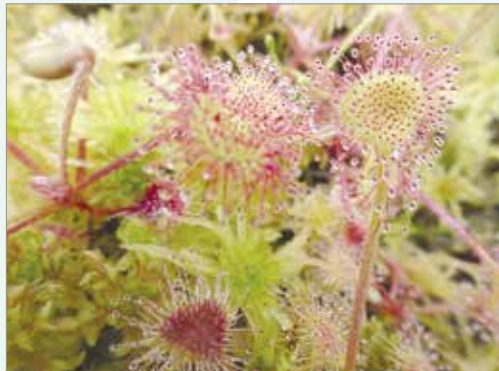
Gwlithlys (Round-leaved Sundews, Drosera rotundifolia ) a mwsoglau Migwyn. Mae desmidau i'w gweld yn y dŵr wedi'u gwasgu o'r Migwyn | Round-leaved Sundews (Chwys yr Haul, Drosera rotundifolia ) and Shagnum mosses. Desmids are found in the water squeezed from Sphagnum .

Some species came via research students at the Field Centre and were not always desmids! In 1993, two MSc students surveying the animal life of Gwynllyn Lake, Rhayader (SN947690) found the dominant aquatic plant, Water Milfoil Myriophyllum alterniflorum , was covered in slimy green filaments thought to be the alga Mougeotia capucina .