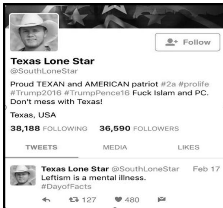
Document 1 : un compte parodique de l'IRA.

Dans l'imaginaire populaire et politique, le travail de l'Internet Research Agency (IRA) et ses tentatives d'ingérence dans l'élection présidentielle américaine de 2016 représentent l'archétype de la campagne de désinformation. Par ailleurs, si certains des comptes les plus efficaces de l'IRA imitent délibérément des identités sociales de l'extrême droite, ce n'est pas une coïncidence : ils adoptent ouvertement des identifiants qui évoquent une certaine personnalité. Goffman [1961] montre qu'il existe des « kits identitaires » associés avec des positions spécifiques dans la hiérarchie sociale, notamment des objets et des styles vestimentaires spécifiques auxquels on associe du sens. En se les appropriant, les opérateurs des comptes sont capables d'infiltrer des communautés de pensée numériques pour communiquer directement avec une certaine audience visée. Le document 1 présente l'avatar et la biographie d'un des comptes les plus (re)connus de l'IRA, avec des marqueurs identitaires évidents :